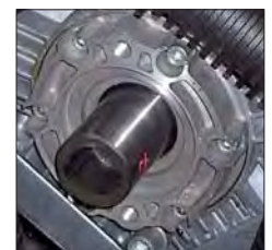
● POST. - ARRIÈRE POSTERIOR