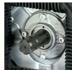
● POST. - ARRIÈRE POSTERIOR